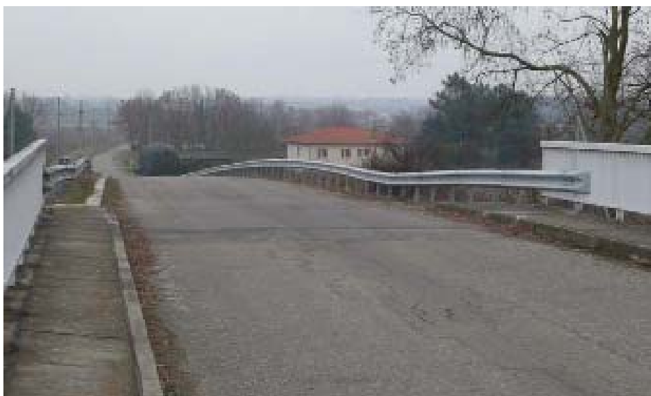
Photo 2 - Affaissement d'un remblai contigu marqué par la déformation des barrières de sécurité

L'introduction de cette exigence permet d'augmenter la sécurité globale de l'ouvrage et doit réduire la sinistralité importante couramment observée sur ces remblais contigus (photo2).