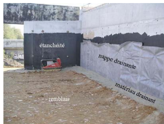
Photo 3 - Mise en œuvre d'une nappe drainante complétée par un matériau drainant au contact d'une culée