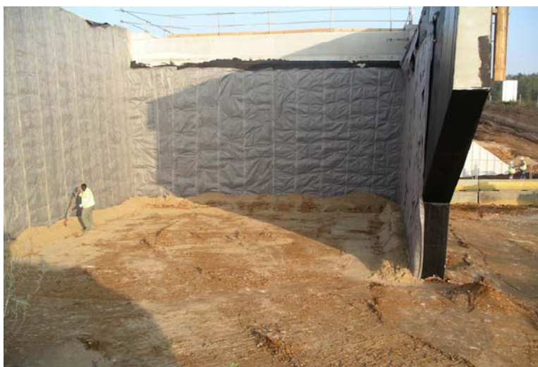
Photo 1 - Mise en œuvre d'une nappe drainante sur le badigeon de protection (en noir) d'une culée

Dans le cas de matériaux granulaires présentant un passant à 80 µm compris entre 5 et 12% (grave silteuse par exemple, matériau de classe GTR B31), il y a lieu de mettre en œuvre un dispositif de drainage (couche drainante, géocomposite...) pour à la fois drainer et protéger le parement (photo 1). L'utilisation d'un dispositif géosynthétique fera l'objet d'un examen attentif de ses caractéristiques principales au regard du projet (résistance à la traction, résistance au poinçonnement, permittivité et transmissivité sous contraintes).