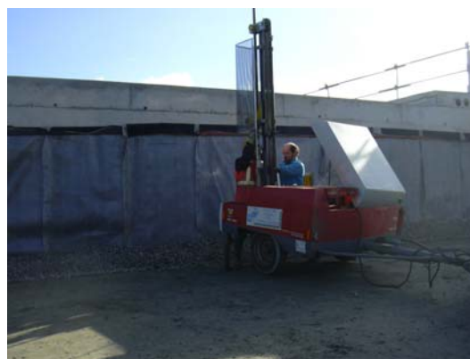
Photo 6 - Contr le de remblais contigus au p n trodensitographe   mi-hauteur (cr dit : LR Saint-Brieuc)

La v rification de la masse volumique au gammadensim tre peut  tre prescrite (norme NF P 94-061 [12], cf. fiche 18 fascicule 3 du guide de conception des terrassements [3]). Cependant compte tenu de la faible  paisseur d'auscultation (10   40 cm), plusieurs s ries de mesures s'av r ent n cessaires. Il faut enfin rappeler que ce mode de contr le ne peut s'effectuer qu'en r f rence   un  tat de compactage optimum d fini lors d'une  tude en laboratoire ou sur planche d'essai. Ce mode de contr le suppose donc la r alisation de mesures "en continu" tout au long de l'ex cution du remblai.