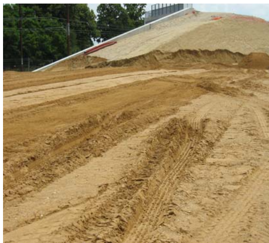
Photo 4 - Remblai courant réalisé postérieurement au remblais contigu et son remblai d'accompagnement, réalisation de redans à l'avancement

Il existe 3 cas de figures en règle générale :