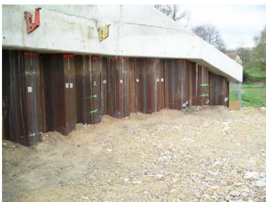
Photo 5 - Remblai contigu en cours d'ex cution. Les  paisseurs maximales des couches ont  t  not es   la peinture verte sur les palplanches m talliques (cr dit : LR de Rouen)

Il convient de s'assurer de l'ad quation des proc dures d'ex cution des remblais contigus aux prescriptions requises.