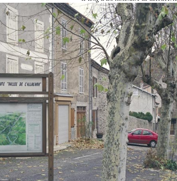
Création d'un relais d'information service le long d'un itinéraire de découverte