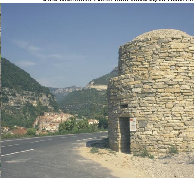
Réhabilitation d'une construction traditionnelle visible depuis l'autoroute