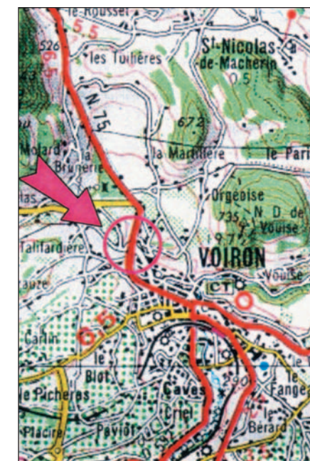
L'aménagement concerne l'entrée Nord de Voiron sur la RN 75.

L'aménagement concerne l'entrée nord de Voiron (Isère) par la RN 75, appelée aussi Avenue du 8 mai 1945 dans la partie urbanisée. Le traitement d'entrée s'étend sur 500 mètres et comprend divers aménagements: traitement de carrefour, réduction de 3 à 2 voies, terre plein central différencié, traversées piétonnes en deux temps et bande cyclable.