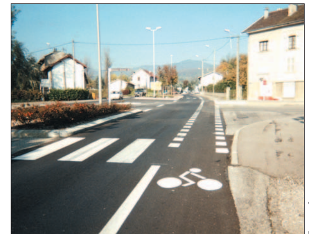
PHOTO 2 - Sur cet itinéraire fréquenté par les cyclotouristes, la circulation des vélos est facilitée et sécurisée par la création d'une bande cyclable dans le sens montant.

L'aménagement principal concerne le carrefour avec la rue du Faubourg Sermorens dont l'originalité est de traiter les mouvements de tourne-à-gauche au moyen d'un îlot peint circulaire. Le fonctionnement est correct en raison de la largeur de la partie centrale qui permet le stockage d'un poids lourd ou de deux voitures. La concertation a permis d'améliorer les solutions concernant la giration des poids lourds et l'accès à une station service. Par ailleurs des arbres ont été plantés transversalement à l'axe principal afin de mieux marquer le débouché des rues secondaires.