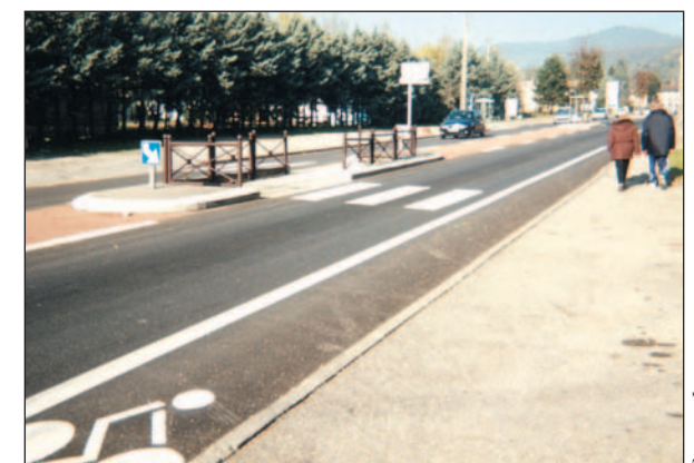
PHOTO 3 - La réduction de 3 à 2 voies s'est accompagnée de la création d'un terre-plein central de couleur différenciée. Les traversées des piétons sont quant à elles sécurisées à l'aide d'îlots permettant une traversée en deux temps.