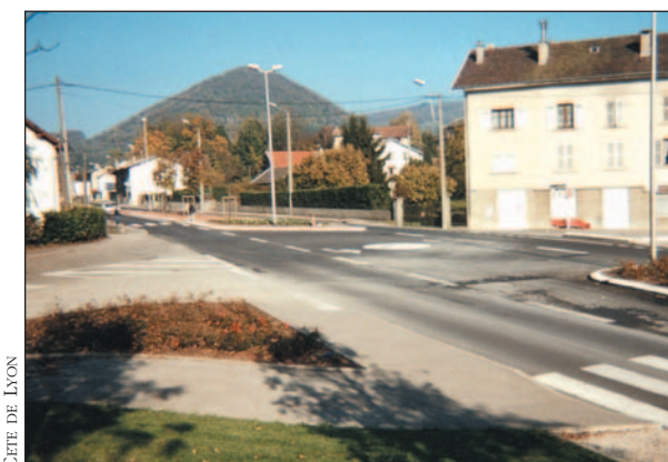
PHOTO 1 - Outre la création d'îlots sur les voies secondaires et l'organisation des traversées piétonnes, l'aménagement du carrefour principal présente l'originalité de traiter les mouvements de tourne à gauche au moyen d'un îlot circulaire peint au centre.